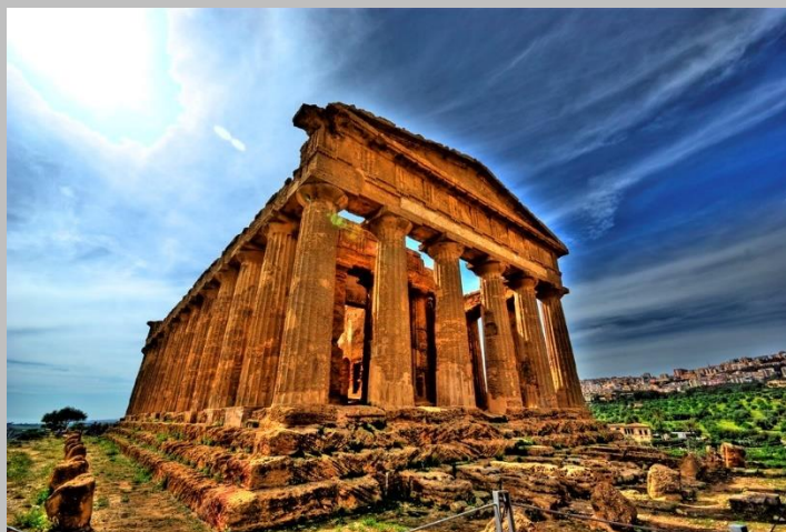
Valle dei Templi, Casa di Pirandello

7:45 Ritrovo dei partecipanti presso Porta Felice (Foro italico Umberto I)