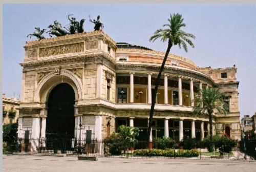
PIAZZA RUGGERO SETTIMO, PALERMO